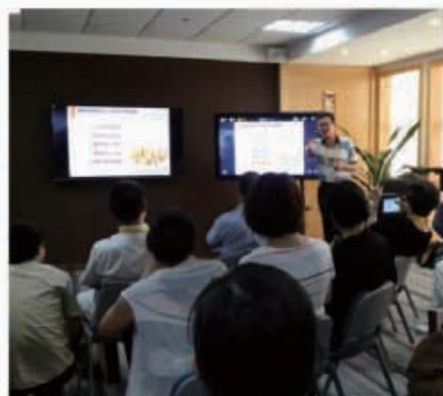
华侨大学云教育技术实验室