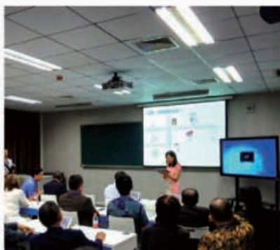
华中师范大学智慧教学基地

唐风汉语还与华侨大学合作承办了第三届世界华文教育大会华文教育智慧教学分论坛，承担了第六届亚太地区国际汉语教学学会年会、和君集团 15 周年年会、盛和塾年中会议等多场会议支持。运用云录播技术将会议实况采集到云端，同步进行碎片化处理，实时面向全球进行直播。所有参会人员均可通过微信扫描二维码，获得会议演讲的视频、演讲稿，实现了会议资料的无纸化分发。