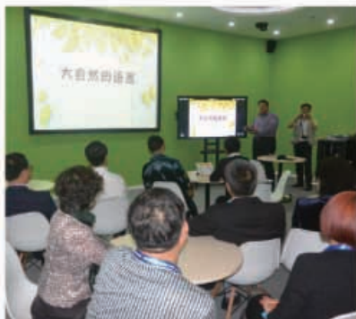
伟东集团云教育基地