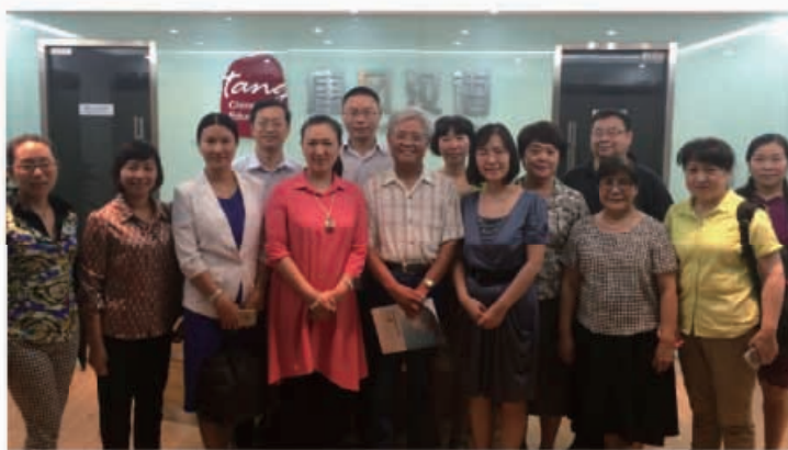
高校教师考察交流会